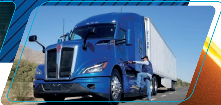
Acceso rápido y fácil a cabina

Los escalones para acceder a cabina son más amplios y seguros.