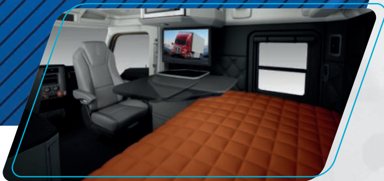
Comodidad a la hora del descanso

Con el sistema de telemetría Truck Tech Plus permite el diagnóstico remoto y oportuno de la operación del motor y su sistema de postratamiento, ahora con la funcionalidad Over The Air, permitirá realizar las actualizaciones de manera segura y sencilla, ya sea desde sus instalaciones o mientras se encuentre en ruta, sin tener que llevar la unidad a unos de los centros de servicio. Ahorrando tiempo, dinero y mantener más tiempo la unidad en el camino.