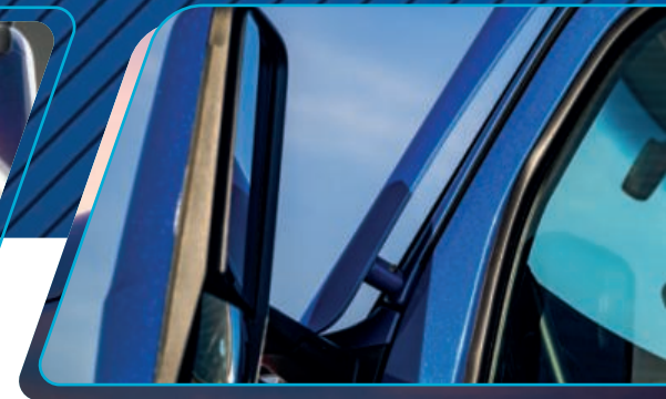
Espejos funcionales y duraderos