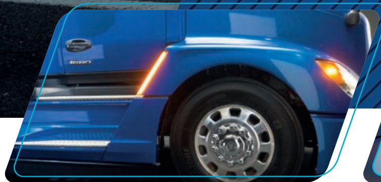
Línea de diseño aerodinámica

Está diseñado especialmente para optimizar la rentabilidad de las operaciones en las líneas de transporte. Su sofisticada y elegante línea de diseño aerodinámico sobresale en carretera y eficiencia de combustible. El T680 Next Gen cuenta con una nueva defensa y capó aerodinámicos, faldones y guardafangos