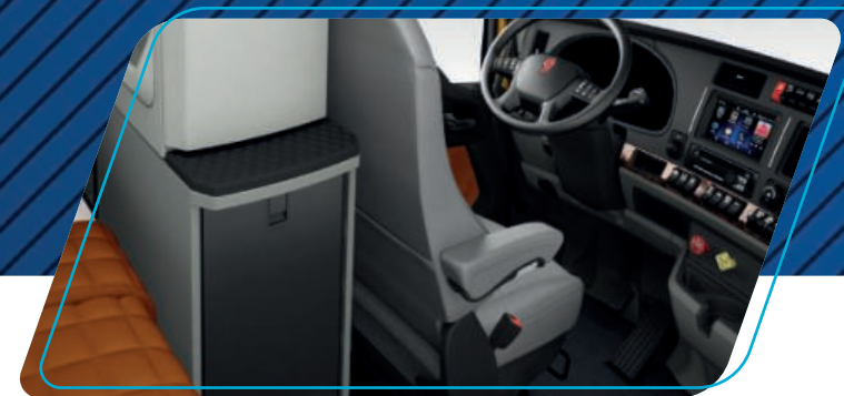
Amplitud y ergonomía