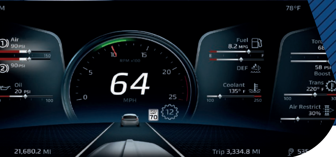
Innovadora pantalla digital de 15 pulgadas

La arquitectura tecnológica permite desde una conexión básica de Bluetooth hasta el flujo de información en tiempo real . El nuevo volante Kenworth SmartWheel combina sus controles intuitivos con la innovadora pantalla digital de 15 pulgadas y el nuevo sistema de instrumentación digital para una visualización perfecta y personalizable.